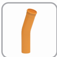
Curva Coletor Esgoto 22° 30' Longa JE