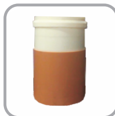
Adaptador Ponta Ocre x Bolsa Esgoto Branco JE