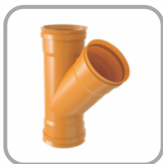
Junção Coletor Esgoto JE

DN: 100 / 150 / 200 / 250 / 150 x 100 / 200 x 100 / 200 x 150