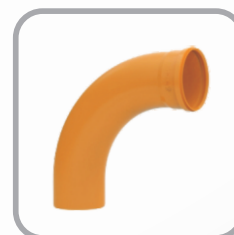
Curva Coletor Esgoto Longa 90° JE