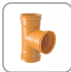
TEE Coletor de Esgoto BBB / BBP JE