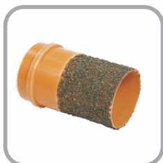
Adaptador Bolsa Coletor x Ponta Cerâmica JE