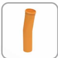
Curva Coletor Esgoto 11° 15' Longa JE

DN: 150 x 100 / 200 x 100 / 200 x 150 / 250 x 100 / 250 x 150 / 250 x 200