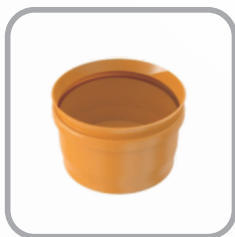
CAP Coletor de Esgoto JE

DN: 150 x 100 / 200 x 100 / 200 x 150 / 250 x 100 / 250 x 150 / 250 x 200