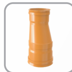
Redução Excêntrica Coletor Esgoto PB JE

DN: 150 x 100 / 200 x 100 / 200 x 150 / 250 x 100 / 250 x 150 / 250 x 200