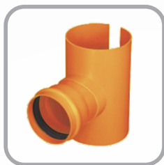
Selim tipo Sela Coletor Esgoto JE

DN: 100 x 100 / 150 x 100 / 200 x 100 / 200 x 150 / 250 x 100 / 250 x 150