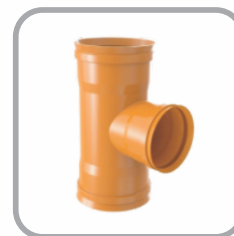
TEE de Redução Coletor de Esgoto BBB / BBP - JE

DN: 150 x 100 / 200 x 100 / 200 x 150 / 250 x 100 / 250 x 150 / 250 x 200