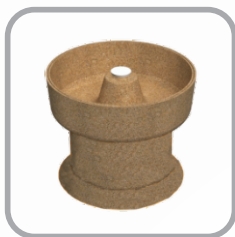
Tampão Completo para TIL Ocre JE