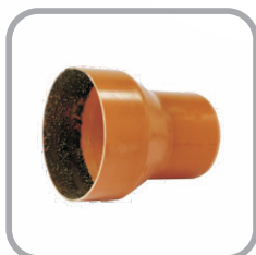
Adaptador Ponta Ocre x Bolsa Cerâmica