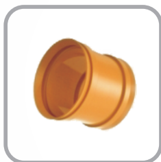
Luva de Correr Coletor de Esgoto JE / JEI

DN: 100 / 150 / 200 / 250 / 150 x 100 / 200 x 100 / 200 x 150