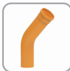
Curva Coletor Esgoto Longa 45° JE