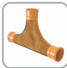
TIL de Passagem de Rede JE

DN: 100 x 100 / 150 x 100 / 200 x 100 / 200 x 150 / 250 x 100 / 250 x 150