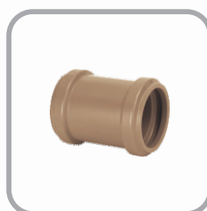
Luva de Correr PBA JE