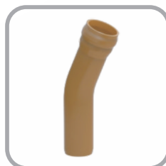
Curva PBA 22°30' com Ponta e Bolsa JE