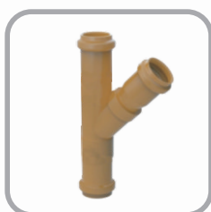
Junção 45° PBA JE