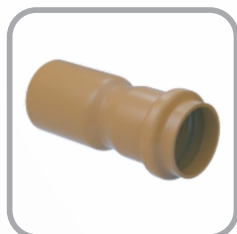
Adaptador à Luva de Fibrocimento PBA