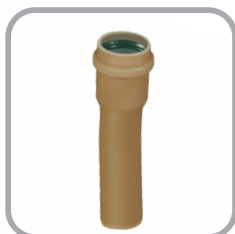
Curva 11°15' PBA JE