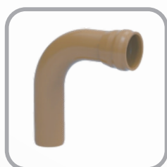
Curva 90° PBA com Ponta e Bolsa JE